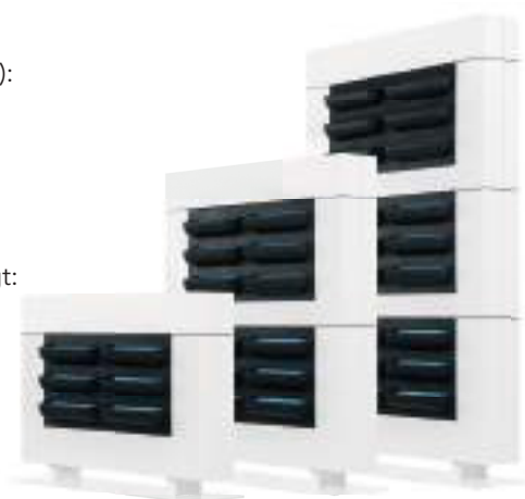
LiveDivider PLUS 1 LiveDivider PLUS 2 LiveDivider PLUS 3

Sockelplatte und Rahmen des LiveDivider PLUS bestehen aus pulverbeschichtetem Stahl und sind vollständig recycelbar.